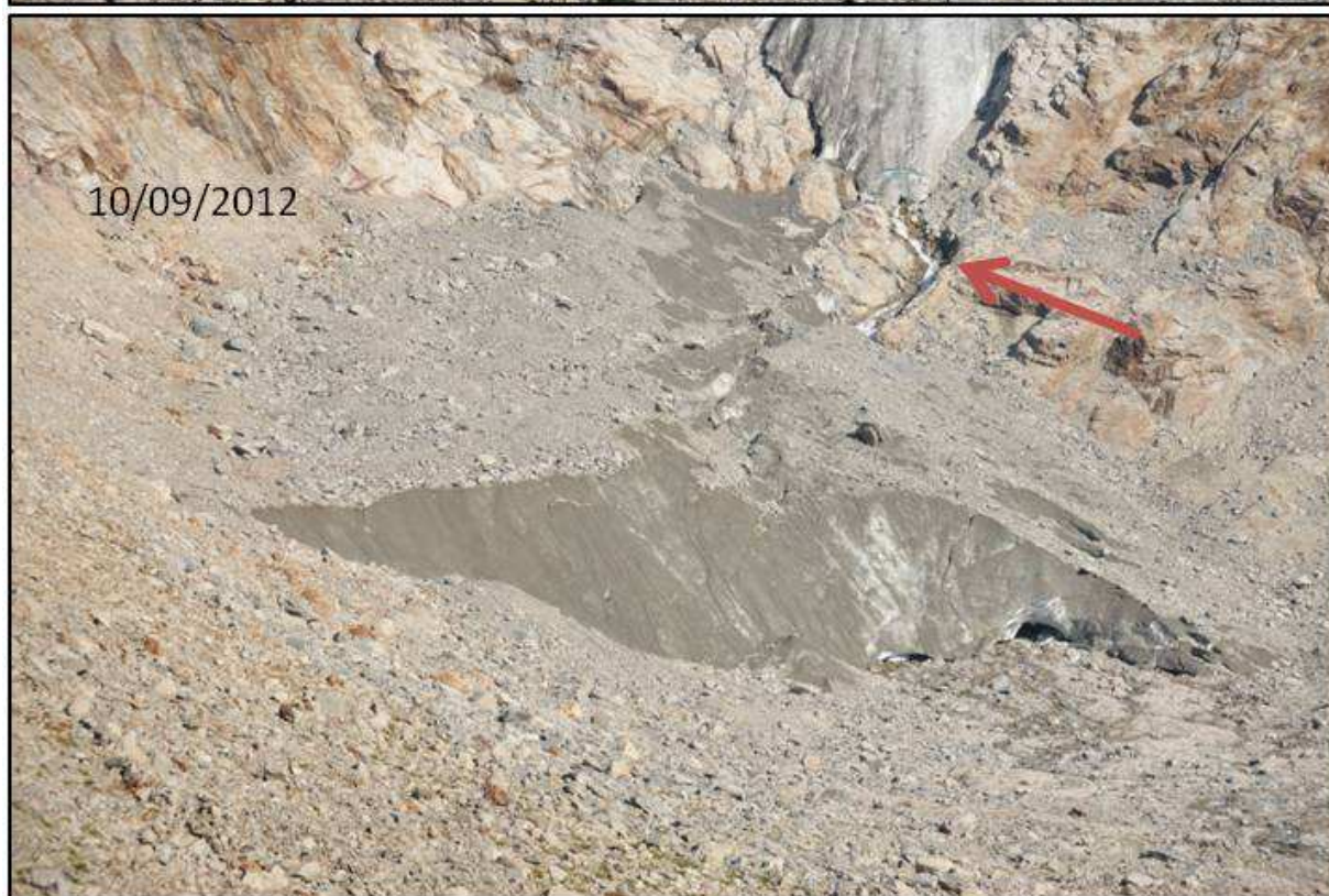
Immagine 2: confronto fotografico della fronte del ghiacciaio di Pré de Bard il 9 luglio (in alto) e il 10 settembre 2012 (in basso); la freccia indica la cavità il cui progressivo allargamento ha portato alla separazione della lingua.