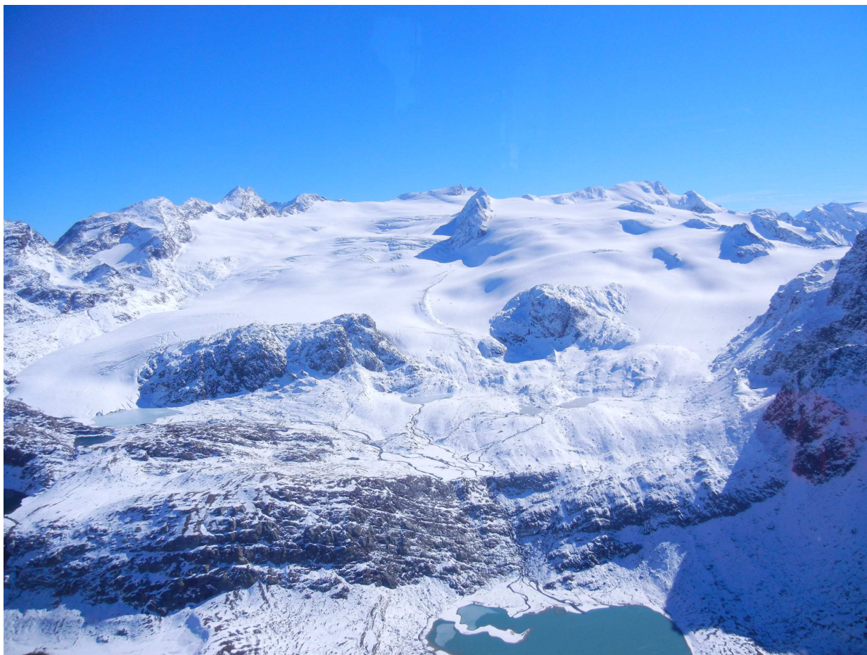
Immagine 2: il ghiacciaio del Rutor il 17 ottobre 2013, giorno dell'ultimo rilievo, già abbondantemente innevato.

FONDAZIONE MONTAGNA SICURA MONTAGNE SÛRE